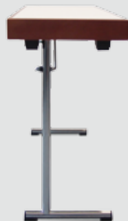
Beschlag parlamentarisch einsäulig