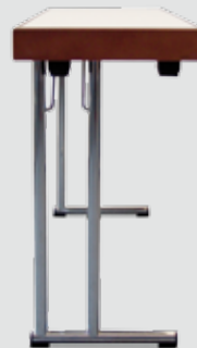
Beschlag parlamentarisch zweisäulig