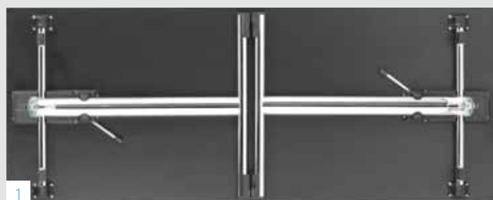
Bild 1: Die Aufnahme zeigt den patentierten Tischbeschlag von unten.