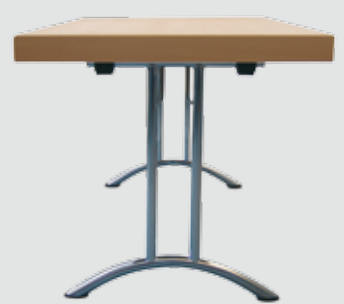
Kufen-Beschlag zweisäulig ab einer Mindestbreite von 55 cm