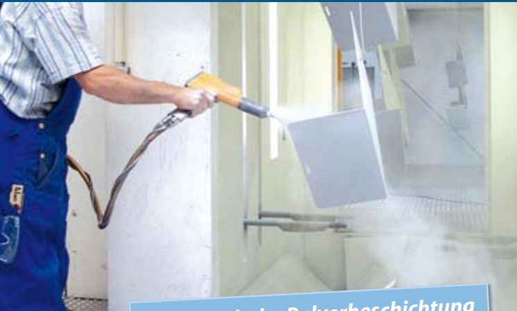
Automatische Pulverbeschichtung und Nachbeschichtung von Hand.