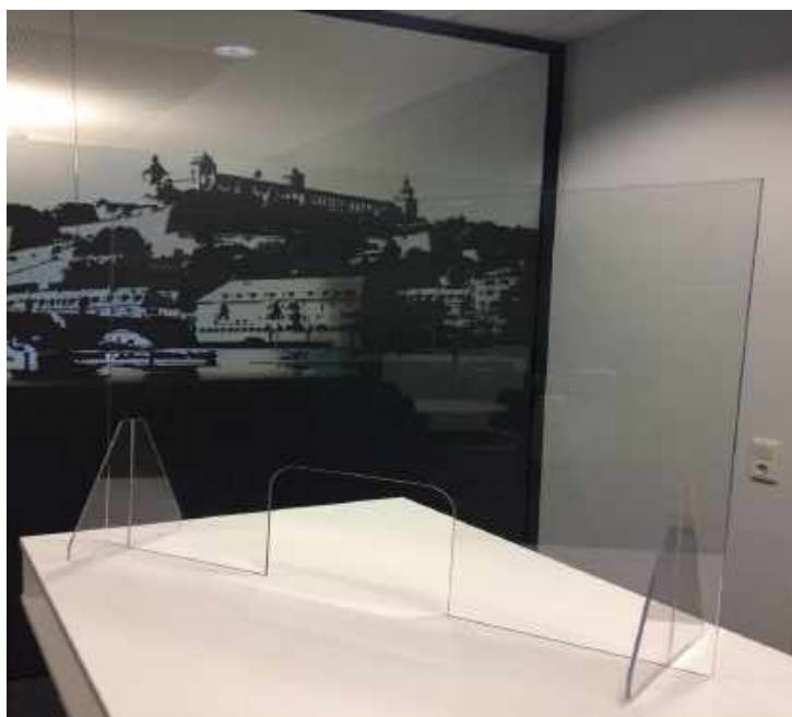
Beispiel eines Hygieneschutzes mit Acrylglasfüßen

Die Fertigungsmöglichkeiten bieten Laser- und Fräsbearbeitungen, biegen, bohren und vieles mehr an. Von maßgeschneiderten Aussparungen (Durchreiche), z.B. für ein EC-Kartenlesegerät, individueller Formgebung, angepasst an Ihren Einsatzbereich vor Ort, bis zu individuellen Löchern für die Montage. Wir liefern Ihnen vom Einzelstück bis hin zur Serienware in größeren Stückzahlen.