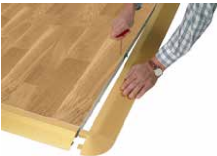
Abb. Oberfläche abweichend