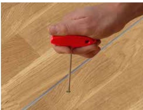
Abb. Oberfläche abweichend