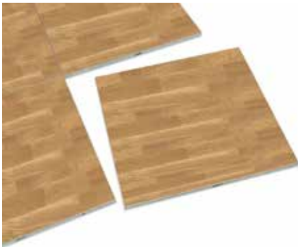
Abb. Oberfläche abweichend