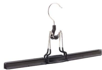
Skirting Bügel 1-3 m